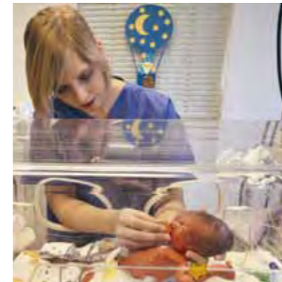
Für den Begriff Unabhängigkeit formulieren wir 1

Die Rotkreuz- und Rothalbmondbewegung ist unabhängig. Wenn auch die Nationalen Gesellschaften den Behörden bei ihrer humanitären Tätigkeit als Hilfsgesellschaften zur Seite stehen und den jeweiligen Landesgesetzen unterworfen sind, müssen sie dennoch eine Eigenständigkeit bewahren, die ihnen gestattet, jederzeit nach den Grundsätzen der Rotkreuz- und Rothalbmondbewegung zu handeln.