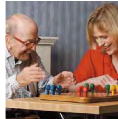
Für den Begriff Menschlichkeit formulieren wir 1

Die internationale Rotkreuz- und Rothalbmondbewegung, entstanden aus dem Willen, den Verwundeten der Schlachtfelder unterschiedslos Hilfe zu leisten, bemüht sich in ihrer internationalen und nationalen Tätigkeit, menschliches Leid überall und jederzeit zu verhüten und zu lindern. Sie ist bestrebt, Leben und Gesundheit zu schützen und der Würde des Menschen Achtung zu verschaffen. Sie fördert gegenseitiges Verständnis, Freundschaft, Zusammenarbeit und einen dauerhaften Frieden unter allen Völkern.