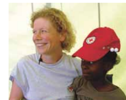
Daraus ergibt sich für unser Verständnis von Schwesternschaft