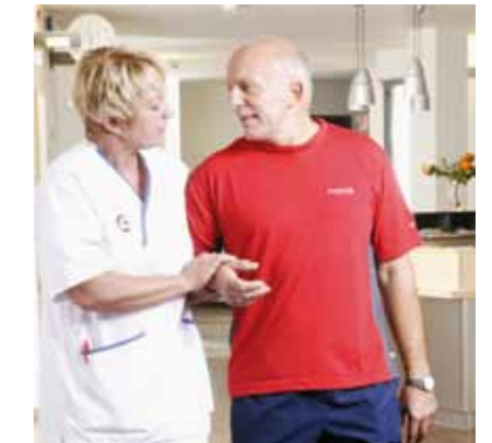
Daraus ergibt sich für unser Verständnis von Schwesternschaft