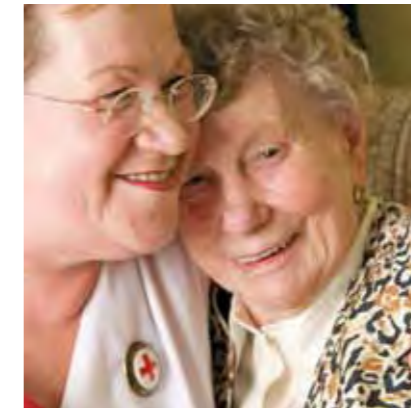
Daraus ergibt sich für unser pflegerisches Handeln 2

Menschlichkeit ist das Grundprinzip aller humanitären Hilfe im In- und Ausland.