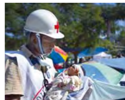
Für den Begriff Unparteilichkeit formulieren wir 1

Die Rotkreuz- und Rothalbmondbewegung unterscheidet nicht nach Nationalität, Rasse, Religion, sozialer Stellung oder politischer Überzeugung. Sie ist einzig bemüht, den Menschen nach dem Maß ihrer Not zu helfen und dabei den dringendsten Fällen Vorrang zu geben.