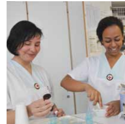
Für den Begriff Einheit formulieren wir 1

In jedem Land kann es nur eine einzige nationale Rotkreuz- oder Rothalbmondbewegung geben. Sie muss allen offen stehen und ihre humanitäre Tätigkeit im ganzen Gebiet ausüben.