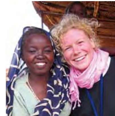
Daraus ergibt sich für unser pflegerisches Handeln

Gegen Inhumanität ist nicht Neutralität, sondern Stellungnahme erforderlich.