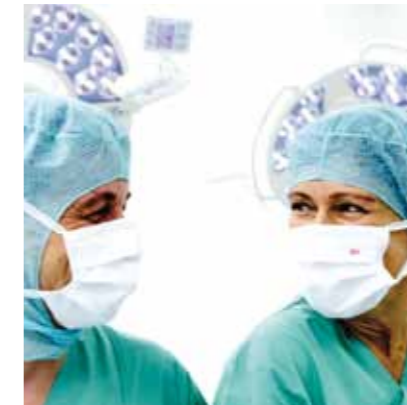
Daraus ergibt sich für unser pflegerisches Handeln

Das Rote Kreuz vereint Menschen in ihrer ganzen Verschiedenheit: im Extremfall Freunde und Feinde.