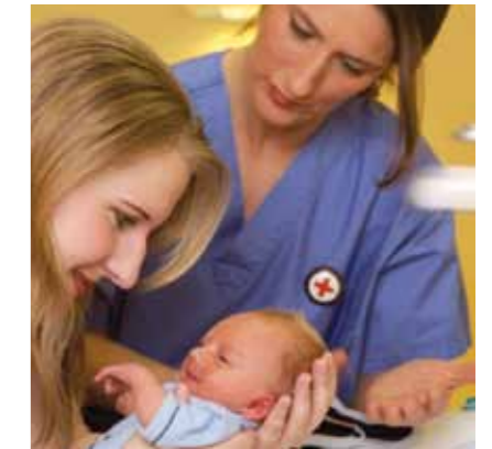
Daraus ergibt sich für unser Verständnis von Schwesternschaft

• dass in einem Auslandseinsatz der Rotkreuz- und Rothalbmondbewegung Neutralität eine Grundvoraussetzung darstellt.