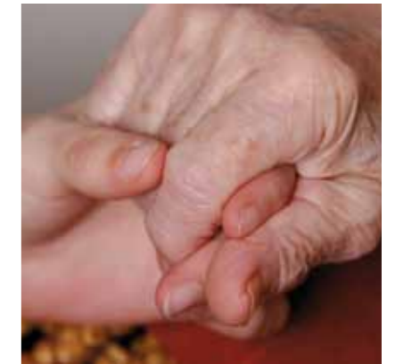
Daraus ergibt sich für unser Verständnis von Schwesternschaft 3