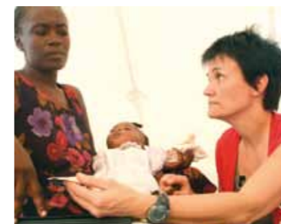
Daraus ergibt sich für unser pflegerisches Handeln