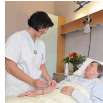
Für den Begriff Universalität formulieren wir 1

Die Rotkreuz- und Rothalbmondbewegung ist weltumfassend. In ihr haben alle Nationalen Gesellschaften gleiche Rechte und die Pflicht, einander zu helfen.