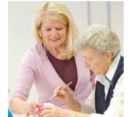
Daraus ergibt sich für unser Verständnis von Schwesternschaft

• dass wir ehrenamtlich Tätige und Angehörige in die professionelle Pflege integrieren und sie sachgerecht anleiten, um die bestmögliche Versorgung der Menschen zu erreichen.