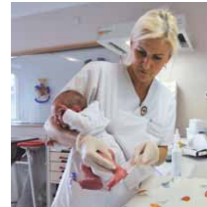
Für den Begriff Freiwilligkeit formulieren wir 1

Die Rotkreuz- und Rothalbmondbewegung verkörpert freiwillige und uneigennützige Hilfe ohne jedes Gewinnstreben.