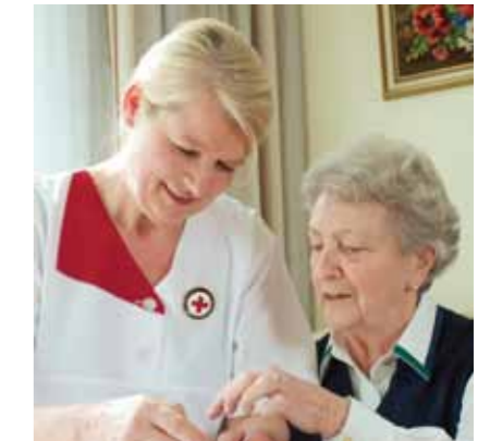
Daraus ergibt sich für unser Verständnis von Schwesternschaft